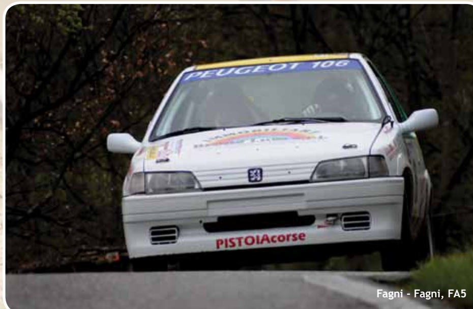
Fagni - Fagni, FA5