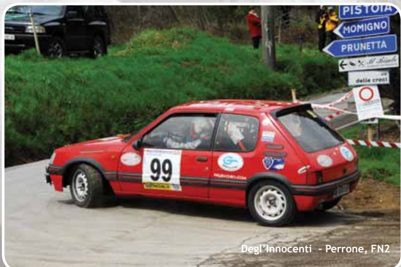
Degl'Innocenti - Perrone, FN2