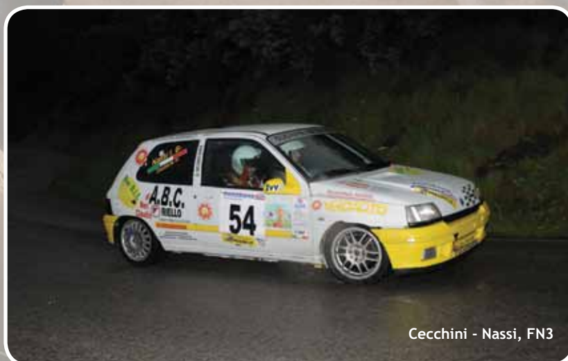
Cecchini - Nassi, FN3