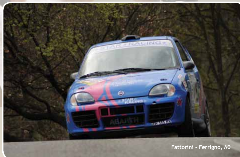
Fattorini - Ferrigno, A0